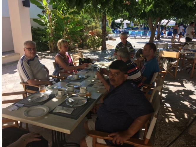
Ontbijt onder bananen- en citrusbomen, een tropische verrassing

Ontbijten met alles erop en eraan. Vele doen al aan het Engelse ontbijt. Witte bonen in tomatensaus, worstjes, spek, toast en eieren in vele vormen.