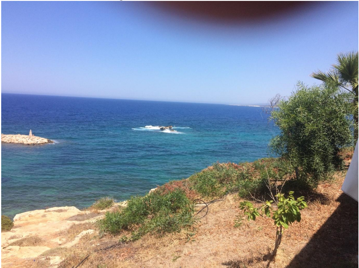
rotsen en uitzicht bij de middellandse zee

Om 17.30 uur terug bij hotel. Daar kregen wij een ontvangstborrel. Met champagne hebben we geklonken op het goede leven. De maag werd verder gevuld met heerlijke hapjes. Daarna op naar het heerlijke diner in Italiaanse stijl. Voor je neus werd allerlei hapjes en perfecte pasta gemaakt.