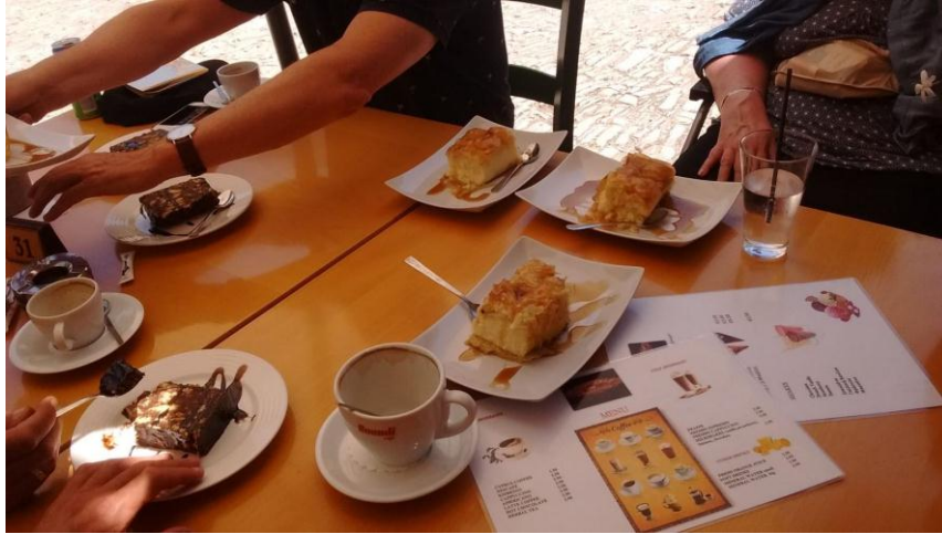
En TAART, veel lokale specialiteiten TAART