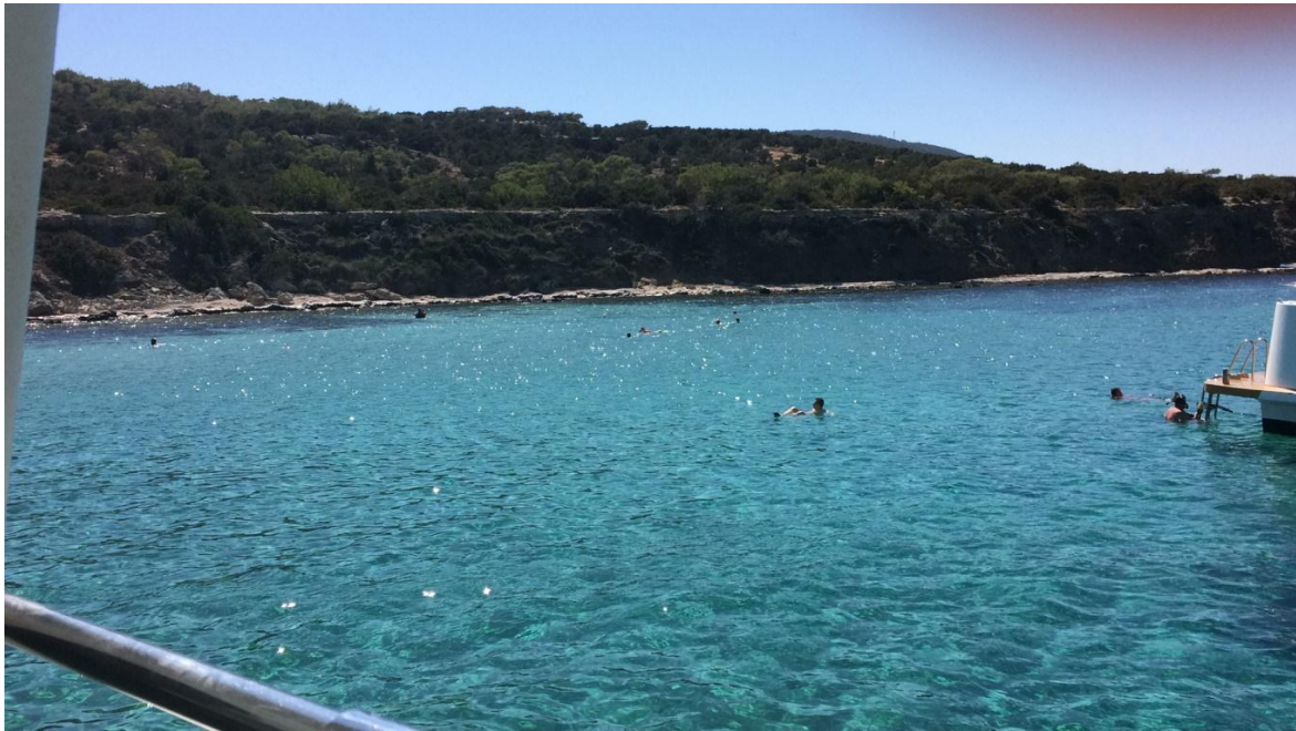
Wat te denken van zwemmen in eigen baai?

Op de boot krijgen we retsinawijn met watermeloen, een echte traktatie.