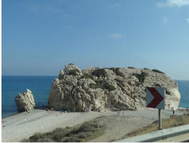
Terug via rotsige kust met mooie vergezichten.