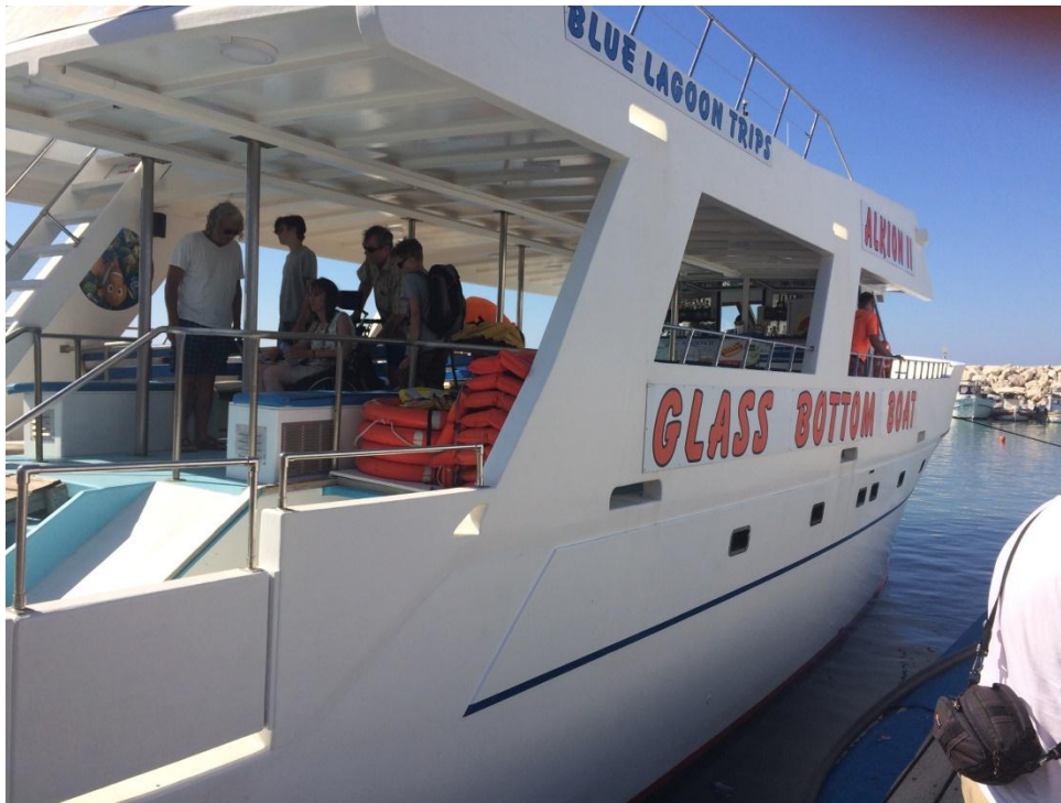
met glazen bodem

Ondertussen op terras bij de rots met prachtig uitzicht over haventje en zee. Aangekomen in klein plaatsje waar de boot ligt, hadden we toch nog behoefte aan een klein hapje. Lekker wat olijven, taramasalade en tzatziki met olijfbrood bij de haven. De boot vertrekt stipt op tijd en met een lekkere bries is het heerlijk toeven op het overdekte terras van de boot. Langs rotsen naar een sprookjesachtig baai waar gezwommen kon worden. Samen met een Engelse dame liedjes zingen. Ondertussen kijken of er dolfijnen gespot worden, helaas geen enkele gezien.