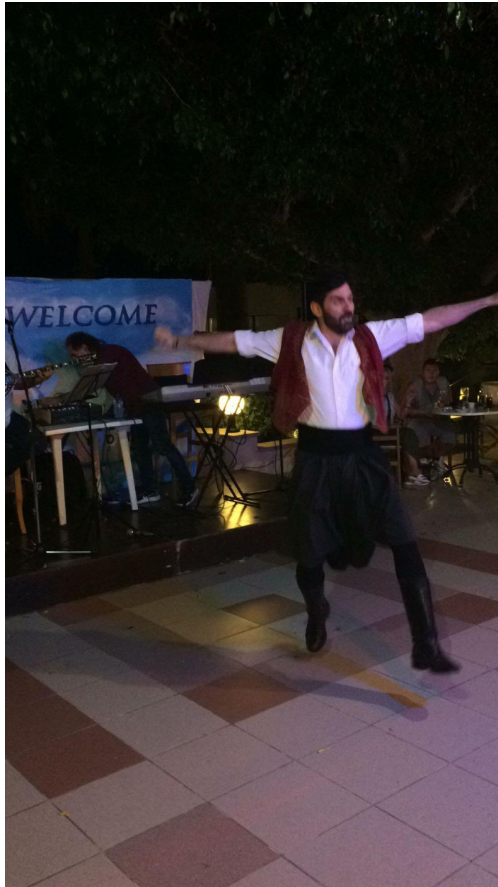
Zorba de Griek

Vol en verzadigd terug gewandeld van het hotel naar de appartementen. Nog nagenieten op de veranda's.