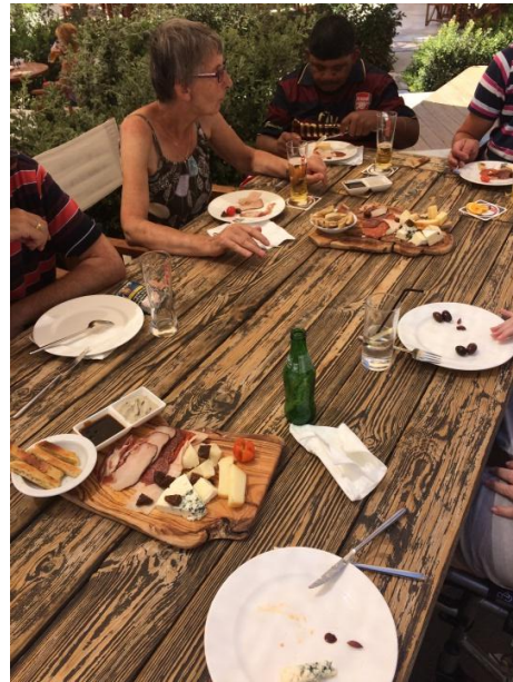
Kaas en charcuterie op z'n Grieks