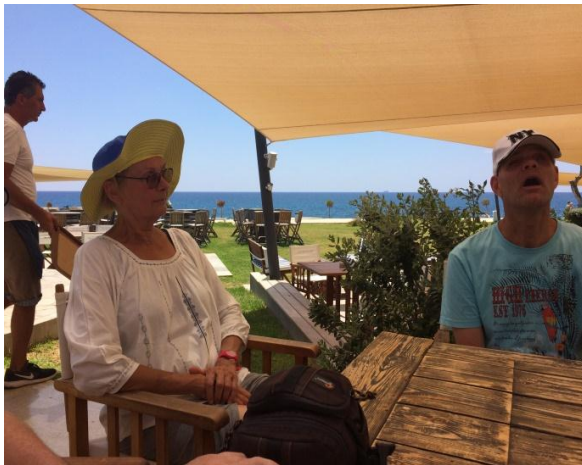
mooie hoed toch?