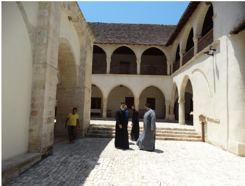
klooster met monniken

Rondgang door kerk met mooie kunst en woondeel voor de monniken. Straatje met wijnmakerij. Hier kan je zien hoe de druiven verwerkt worden tot wijn. Eerste een kleine proeverij. Jaap koopt hier een heerlijke fles wijn. Terug naar de bus, richting strand en rotsen. Bij authentiek terras aan het strand heerlijk bier.