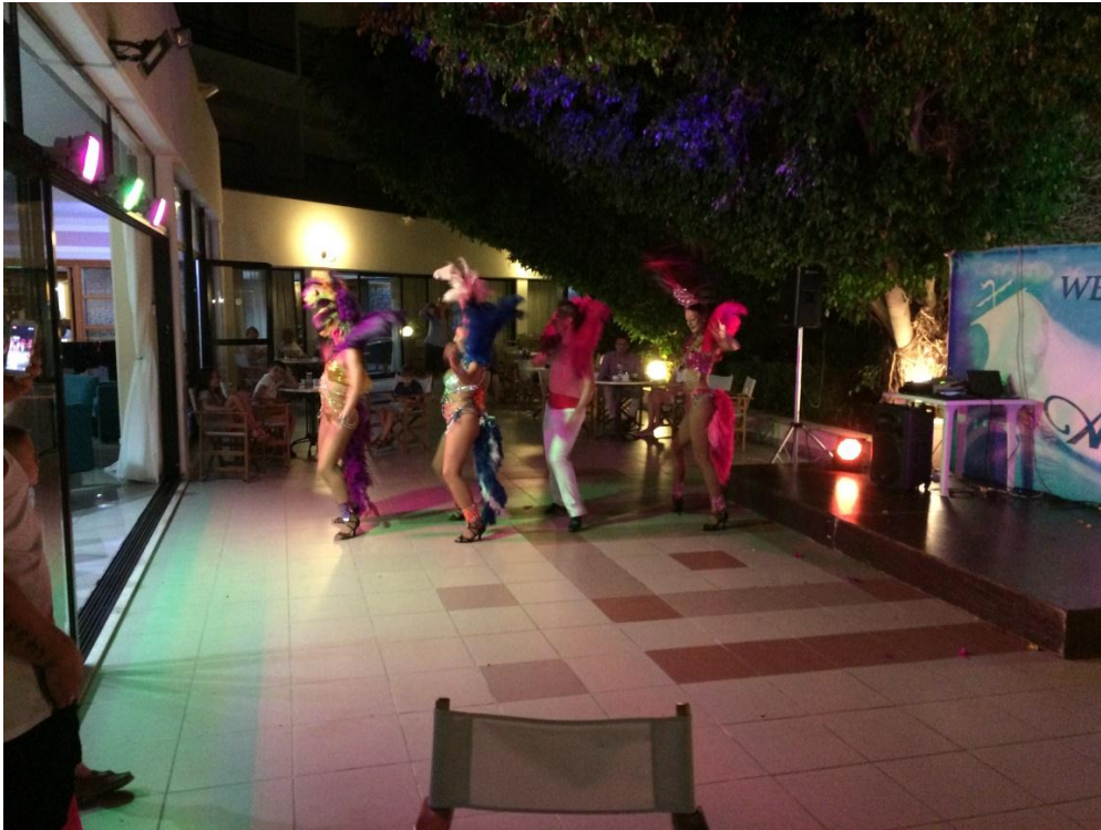
de meisjes met de veren

In de zwoele avond terug gewandeld naar de appartementen. Sommigen direct naar bed, andere nog een afzakkertje op de veranda's. Wat een heerlijke vakantie dag.