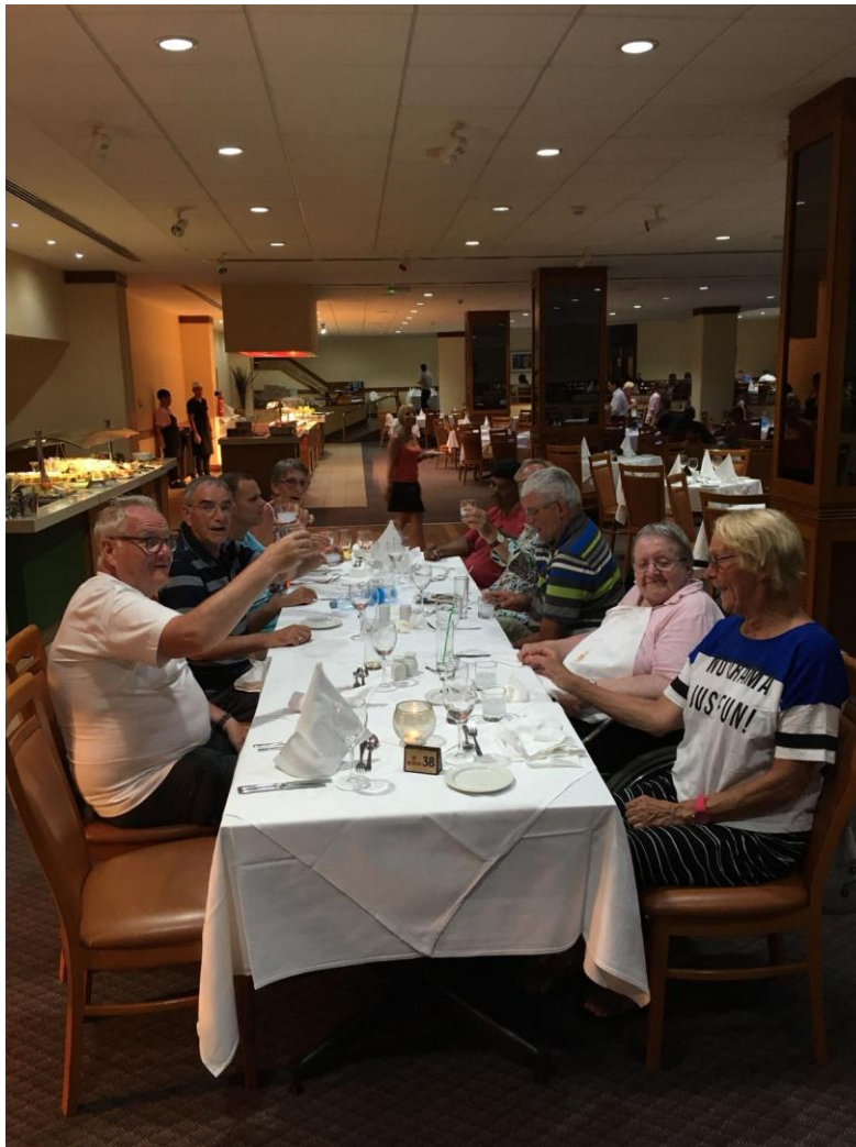
let op de dessertbar links

En zoals het gaat op zo'n hotelcomplex, ieder avond een animeerteam met veel muziek en dans.