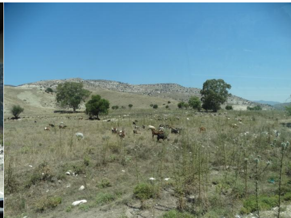
geiten in landschap

Onze Ali de buschauffeur ( https://www.accessibleholidayscyprus.com/transfers/ ) vertelt veel van de omgeving. Veel nieuwe wijngaarden, het wordt daar een heel groot wijng gebied , let maar op.