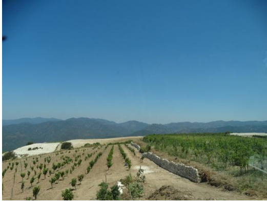
Binnenkort een beroemd wijngebied