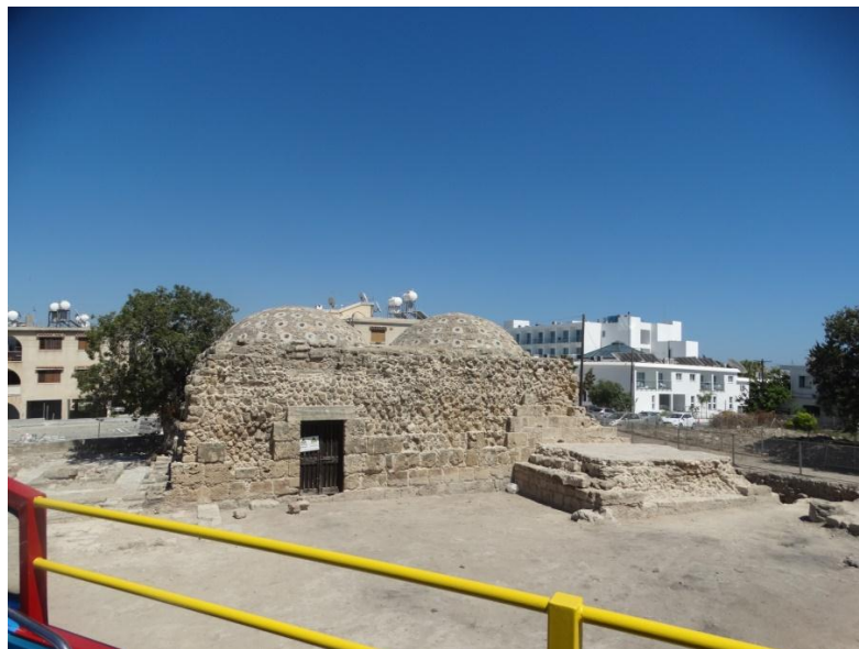
oude kerk en nieuwe appartementen

Maar we zijn niet voor een gat te vangen. We pakken de sightseeing bus. Een rode Engelse dubbeldekker leidt ons langs de beroemde koningsgraven, heel oude christelijke kerkjes uit ca. 450 na Christus.