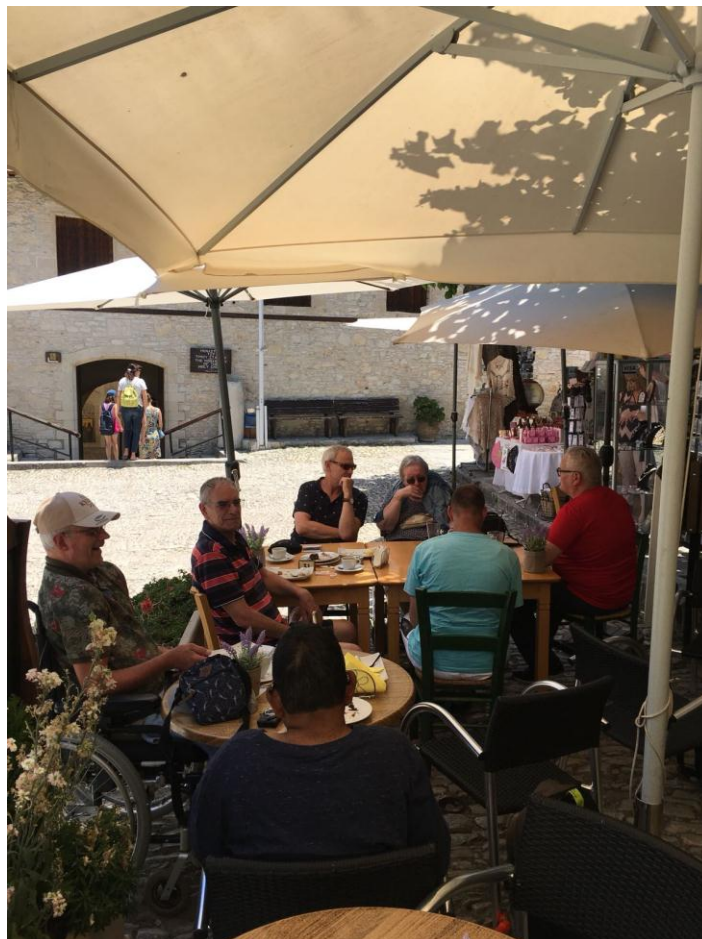
koffie met gebak